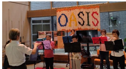
オカリナひばり会