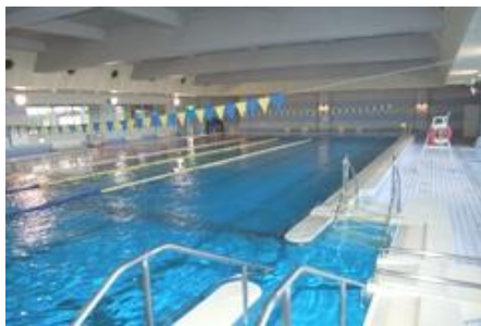
オアシス内プール

オアシスの プール はどなたでも使用していただくことができます！ウォーキングなどができる自由コースや25mを泳ぐ完泳コース、水深が浅い赤台コースの3種類あるのでそれぞれの目的に応じてご利用いただけます。泳ぐことが苦手な方や泳力を向上したい方を対象に専門職員によるワンポイントアドバイスも実施しています。また、高齢者・障害者を対象にした水泳教室やプールレクリエーションなどの講座も年間を通して開催しています。